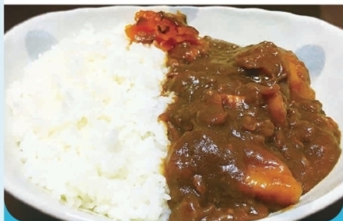
特製カレーライス ¥700-