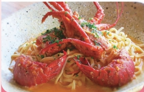
伊勢海老のパスタ(9月中旬～翌6月) ¥2,500-

地産地消と手作りにこだわった人気のレストラン。 落ち着いた雰囲気の店内でゆったりとお過ごしください。