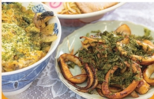
いか焼き定食/さざえ丼 ¥1,700- ¥1,400-

秘伝のタレで焼いた絶品の『いか焼き』、さざえがたっぷり入った『さざえ丼』などが人気のお店です。