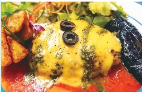
ハンバーグ (サラダ・ライス付) ¥1,540-

肉料理が充実。人気のメニューはハンバーグです。 夜はダイニングバー的なお店です。ぜひお越しください。