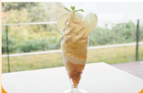
削りメロンサンデー ¥700-