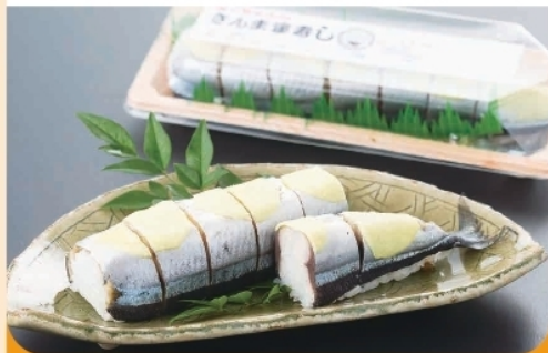
さんま姿寿司 ¥700- (夏期期間は製造販売なし)