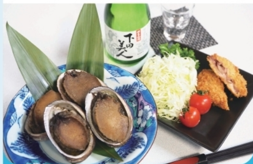
とこぶし100g~/イカメンチ ¥1,200- ¥400-