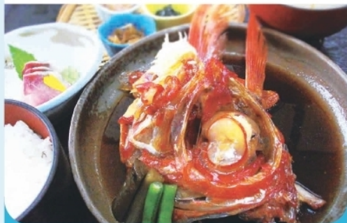
金目鯛煮付け定食 ¥2,530-