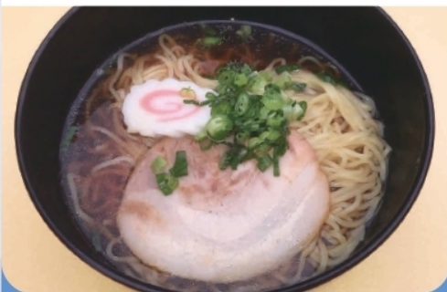
ラーメン・ピラフ/サザエご飯定食 各 ¥600- ¥1,500- (予約)