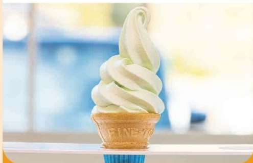
アロエソフトクリーム ¥330-