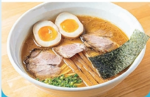
特 真ら~めん ¥ 1,000-

南伊豆町手石800-4 ☎ 0558-62-5750 🕒 11:00~19:30(14:00~17:30休憩) *スープが無くなり次第終了 📅 火曜日 🅑 5台 🪑 テーブル8席/座敷4席/カウンター11席