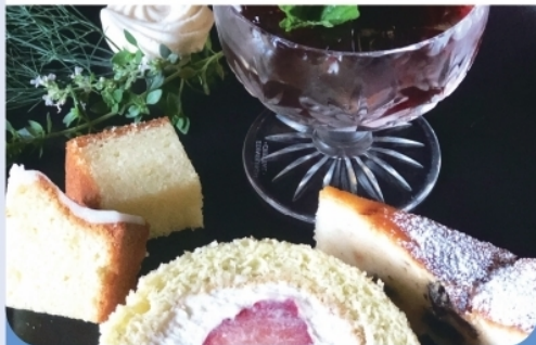
ティーケーキセット ¥1,650-