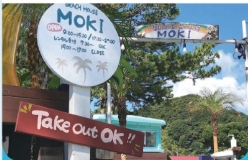
豚バラキャベツ丼 ¥750-