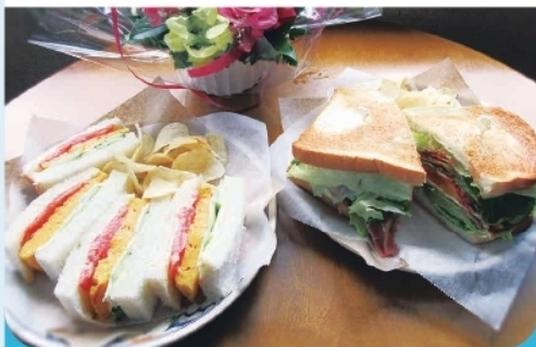
各種サンドイッチ ¥900~