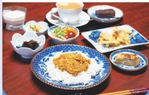
週替わりランチ (コーヒー・デザート付) ¥1,300-

実家に帰ってきたような落ち着いた店内。ランチは週替わりで美味しい家庭料理をご提供いたします。