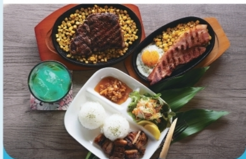
チャモロポークプレート (ガム料理) ¥1,200-

南伊豆町手石917 ☎ 0558-36-3679 営 11:30~22:00 休 不定休 P 3台 席 カウンター5席/テーブル6席