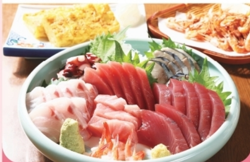
刺身盛合せ/玉子焼きなど ¥500~