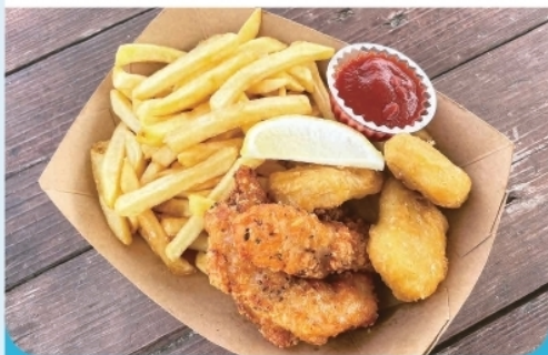
チキンバスケット ¥900-

豊富なレンタル用品から美味しいお食事まで、皆様に気軽にご利用いただける海の家です。