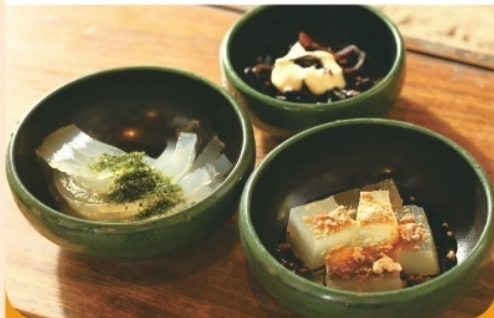
ところてん(酢醤油or黒蜜/ひじき煮物付) ¥400-