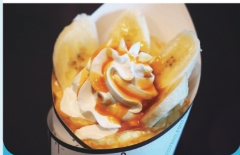
キャラメルバナナクレープ(コーヒー・紅茶付き) ¥700-