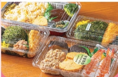
いなか寿司/おにぎり弁当 ¥620- ¥420-

いなか寿司・日替わり・中華弁当のご注文は、 前日までにご予約をお願いいたします。