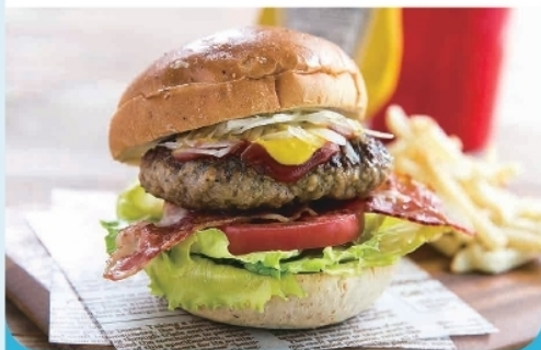
ブルーライズバーガー(ポテト付) ¥ 1,500-

ボリューム満点のハンバーガーが人気! 弓ヶ浜海水浴場と真ん中にできる海の家です。