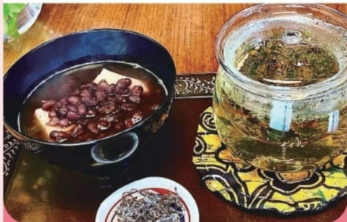
野草茶とぜんざいセット