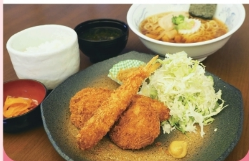
多彩定食/ラーメンほか ¥950- ¥700-