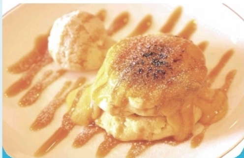
幸せのブリュレパンケーキ ¥1,400-

完全グルテンフリーで、美味しくカラダにも 優しいカフェで安心安全ハッピーなひとときを。