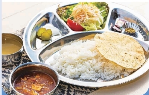
ネパールカレー・ククラ (鶏肉のカレー) ¥950-