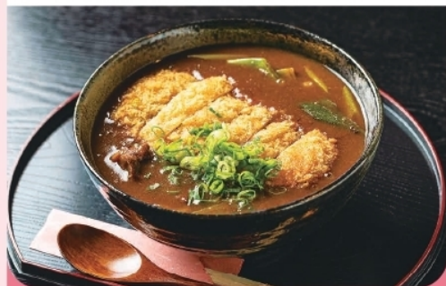
カツカレーうどん or そば ¥800-