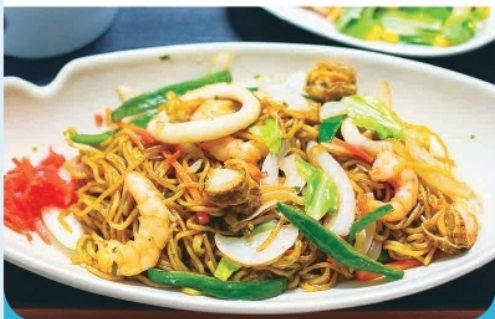
焼きそば・ナポリタン・ピザ ¥1,000-