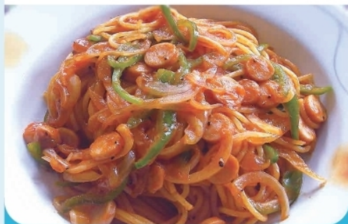
なつかしのナポリタン ¥ 850-

南伊豆町湊415 ☎ 0558-62-4109 🕒 12:00~17:00 📅 木曜日 *カヤックツアー開催の際お休みの場合あり 🅑 6台 🪑 テーブル10席