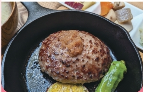
ハッピーハンバーグ定食 ¥1,650- お肉はグラスフェッドビーフなどを使用

地元の自然栽培、有機栽培の野菜を中心に オーガニック食の定食や本格スパイスカレー。