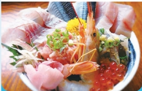
海鮮丼 (ランチ限定10食) ¥1,650-