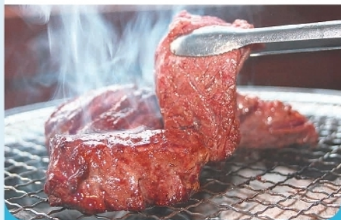
カルビ ¥ 1,200-

南伊豆町湊403-1 ☎ 0558-62-2574 🕒 16:30~21:00(LO20:30) 📅 火曜日 🅑 8台 🪑 座敷8席/テーブル1席